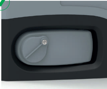
Dispositivo de desbloqueo manual con llave personalizada