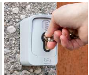
Selector de llave GT-KEY