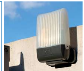
Lámpara de led AURA