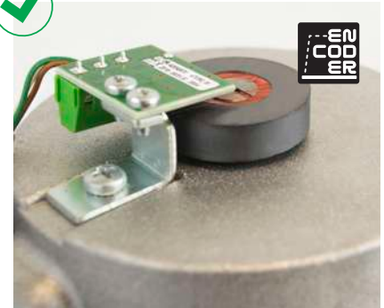
Control del motor a través de encoder que garantiza la detección de obstáculos y la máxima seguridad durante el recorrido