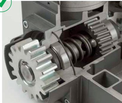
Mecánica interna sólida con componentes en metal y cojinetes de bolas para una mayor durabilidad